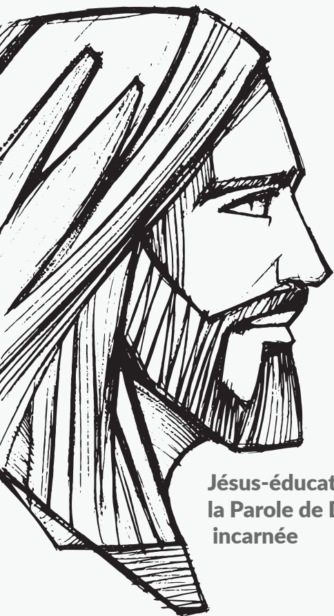
Jésus-éducateur, la Parole de Dieu incarnée

Vous découvrez dans les pages à suivre des suggestions pour faire vivre les quatre entrées du projet d'animation pastorale (PAP) de l'établissement : comprendre, croire, célébrer, vivre. Les propositions sont à situer en cohérence avec le projet catéchétique diocésain .